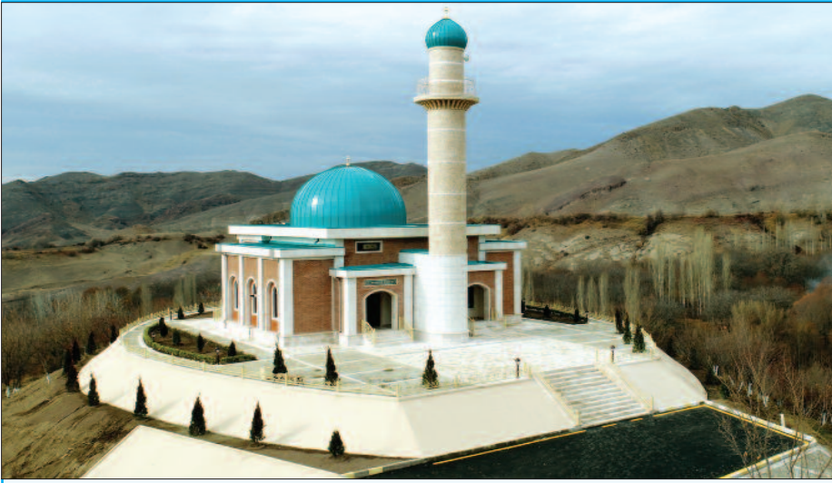
Hörmətli redaksiya! Mərkəzlərdən biri olan qədim yurdumuzda mənəvi dəyərlərin qorun-